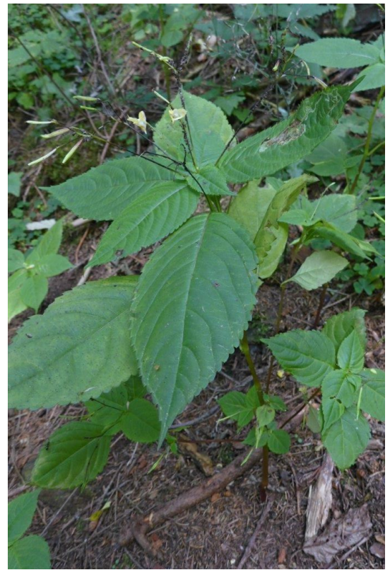
Netýkavka napadená mšicí aj., foto -ah-

Jak jsme už dříve v našem časopisu uvedli, na netýkavce malokvěté i žlaznaté jsme v posledním desetiletí občas pozorovali na jednotlivých rostlinách houčící mšice, přičemž napadené rostliny přežívaly, ale byly ve své horní části oslabené a měly méně semen. Byl to jev velmi řídký. A vysloveně ojedinělý byl výskyt parazitů vytvářejících chodbičky (miny) v listech (viz obrázek). Přelom nastal v roce 2016, kdy se netýkavce nejdříve výborně dařilo a bylo jí všude plno. Během léta se na ní ale plošně rozmnožily jak mšice, tak i jakýsi patogen, a tak jsme mohli vidět vysloveně vedle sebe jedince zdravé i zcela odumřelé (viz zde ). V dalších rocích se na Kuřidle ani na Kalvárii nic mimořádného nedělo, což se vzhledem velkému suchu dalo očekávat. A pokud jde o letošek, přibýlo jak netýkavek zdravých, tak i napadených. Jen jich nebylo tolik jako v roce 2016. Jak to bude na našich lokalitách vypadat v budoucnu, to se nedá dost dobře předpovědět, ale kontrolovat je chceme i nadále. Kdyby pro nic jiného, tak v zájmu jejich atraktivního vzhledu. Díky němu sem můžeme pro veřejnost příležitostně pořádat přírodovědné procházky. V blízkém okolí Strakonice jsou jinak skoro všude Jehličnaté lesy, a tak smíšené porosty s hájovou květenou jsou pro nás vzácností. -ah-