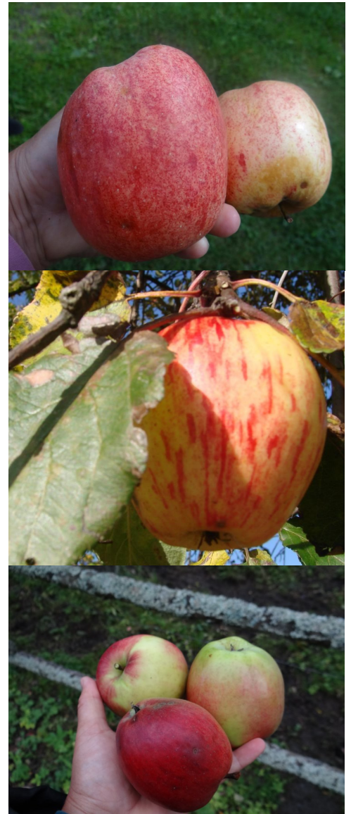
Řehtáč soudkovitý, Williamsovo, Červený válec