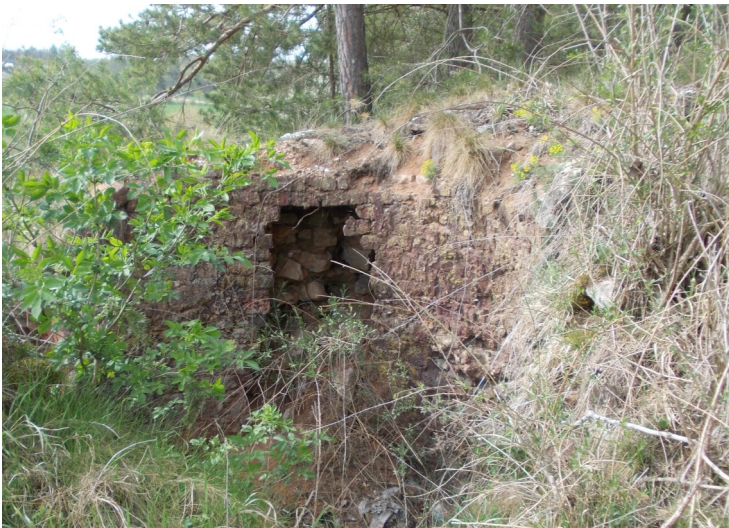
Jedna ze dvou částečně zachovaných pecí - JZ úpatí Zbuše

Geologické podloží Zbuše tvoří především vápenec, čímž se nakonec nijak zvlášť neliší od většiny kopců v této oblasti. Hned z cesty si všimneme, jak je jeho profil v jihozápadní části nápadně jakoby "vykousnutý". Jedná se totiž o dávno opuštěný malý vápencový lom, který pochází s největší pravděpodobností z doby někdy okolo roku 1900. Vápenec se tu tehdy nejen těžil, ale také rovnou zpracovával na surové, tzv. nehašené vápno (oxid vápenatý). Tuto skutečnost ještě dnes potvrzují dvě kopulovité vápenné pece, vybudované z pálených cihel. Najdeme je při jižním okraji lomu. Aktuálně je do značné míry zakryvá vegetace, navíc už jsou propadlé jejich klenby, přesto si na nich stále můžeme prohlédnout několik zajímavých technických detailů, a tak získat obstojnou představu o jejich celkovém vzhledu, konstrukci a fungování.