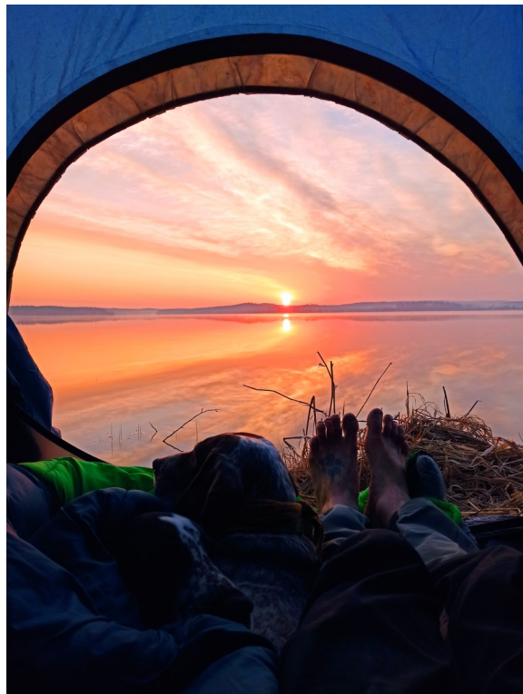
Z Lipna

Vždycky jsem vlastně nerad nosil těžké turistické boty. Bylo mi v nich nepohodlně a horko, tak jsem zkoušel různé možnosti. Většinou běžecské Salomonky nebo sandály. Pak jsem asi před 5 lety na podzim potkal v Bavorsku na jednom z horských vrcholů pána, který tam šel úplně bos. Po kamení, šterku, a vypadal docela spokojeně. Tak jsem to taky musel zkusit. Prvních pár pokusů jsem zkoušel na polních cestách a přišlo mi to fajn. Noha tedy nejprve trochu pálila, ale s každým dnem jsem zvládal delší a delší vzdálenosti. Zvláště s přicházejícím létem to bylo moc příjemné. Za necelý měsíc jsem si na to už zvykl tak, že jsem podnikal bosé výlety po Šumavě. Ze začátku jsem si cesty musel hodně plánovat kvůli terénu. Koupil jsem si i pěknou knihu o bosém chození - Naboso od Daniela Howela, která mě ještě víc utvrdila v tom, že bych měl v tomto pokračovat. Letos na podzim už to bude pátý rok, co jsem s tím začal, a za tu dobu se mi podařilo objevit spoustu benefitů, ale i negativ, na které je třeba si dát také pozor. Co mně na tom nejvíc vyhovuje? Asi ta svoboda. Můžu chodit jakýmkoliv terénem, vodou, bahnem, po sněhu, a nemusím nikde pak sušit plesnivé a špinavé boty. Co mě na tom hodně vzalo, je i to, že je to jedna z forem otužování. A vyplavují se při tom endorfiny podobně jako při zimním plavání. Takže z takového běhu ve sněhu se vrátím vždycky hodně nabitý.