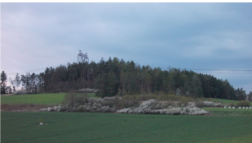
Vrch Slíďová od severovýchodu

Po té, co se dostatečně pokocháme výhledem, vyrazíme - teď už bez velkého otálení - po hlavní cestě rovnou na Domanice, což znamená směrem k severozápadu, majíce les pořád po své pravé straně. Na konci lesní cesty, v místě jejího styku s asfaltovou ulicí, spatříme rozcestník značených turistických tras. Od něho se dále vydáme doleva. Budeme-li mít štěstí, podaří se nám nejspíše na okraji asfaltky či někde v příkopu natrefit na poslední botanickou zajímavost dnešního výletu. Mám na