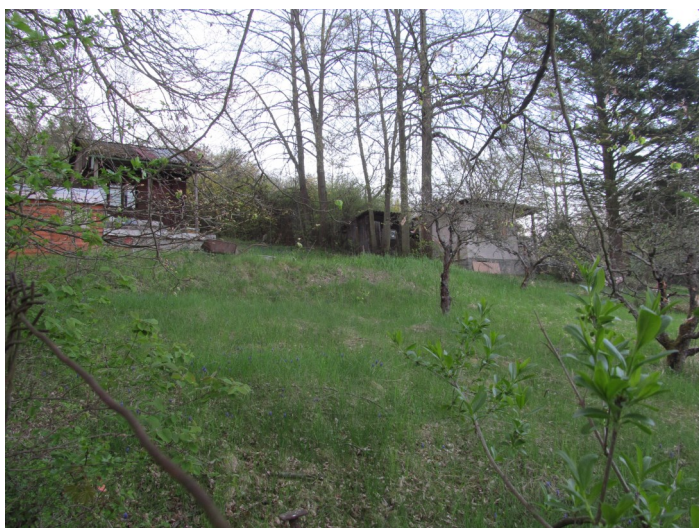
Zahrádky osady Na Vinici

Sídlíště - Jeden z největších komplexů zahrádek v rámci příměstských kolonií. Nachází se mezi vrchem Kuřidlo a rodinnou zástavbou v ul. Prof. Skupy. Osada charakteristického rázu s malými rozměry jednotlivých zahrádek - celé území je v katastru nemovitostí vedeno jako jeden pozemek. Osada bez dílčího oplocení spravována zahrádkářským svazem. V místě se nacházejí objekty pouze malých rozměrů nebo jsou zahrádky zcela bez nich. Osada je přednostně využívána pro samozásobitelství plodinami a je zcela bez staveb pro trvalé bydlení.