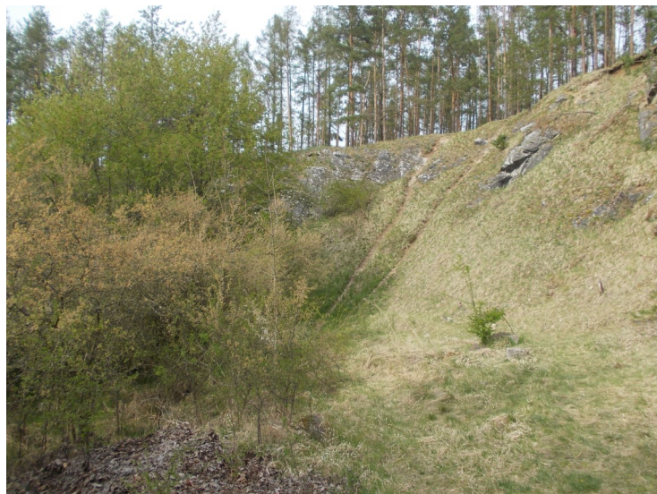
Bývalý vápencový lom na Zbuši