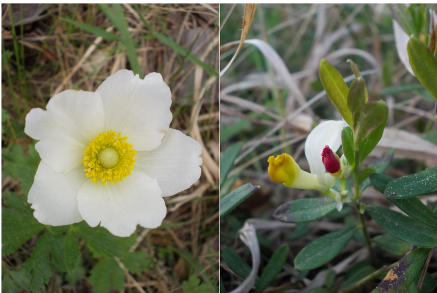
Sasanka lesní, zimostrázek alpský, foto Alan Šturm

roku - plných 32 kusů. Ze vstavačovitých (orchideje) se na Sedlině dá nalézt ještě - ovšem v malém počtu - krušík tmavočervený ( Epipactis atrorubens ). Dále staří známí ze Zbuše, tedy sasanka lesní a zimostrázek alpský, jejichž výskyt v PP Sedlina je však daleko početnější. Potom je třeba zcela jistě uvést hlaváč fialový ( Scabiosa columbaria ), vítod chocholatý ( Polygala comosa ), kozinec sladkolistý ( Astragalus glycyphyllos ) nebo několik druhů violek. Na severozápadním kraji lesa též najdeme poměrně vzrostlý a hezky utvářený exemplář jalovce obecného ( Juniperus communis ).