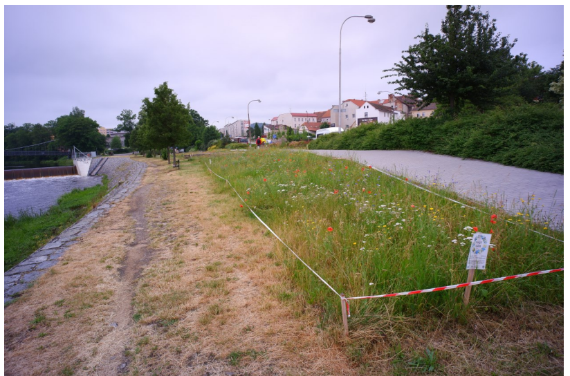
Jednou z přibývajících aktivit je zakládání druhově pestrých louček v obcích

Dnes by se Anton Skřivánek na té samé silnici rozhlížel hlavně po autech, aby ho nějaké nepřejelo. A ani na pěšině by nebyl zaplaven barvami, vůněmi a libými zvuky - byl by obklopený především jednotvárně zelenými lány a tichem nebo případně vzdáleným hučením motorů. Ptáčky zpěváčky by (snad kromě svého jmenovce skři-