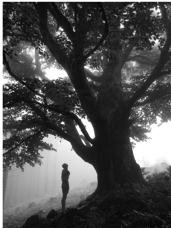
Buk na Ždánově v místě zaniklé obce

Ke změně stravování mě vlastně dost motivovala i moje bosá chůze. Možná proto, že mě donutila trochu zpomalit a začít o věcech víc přemýšlet. Chvilku jsem byl vegetariánem, ale jelikož jsem kvůli tomu stejně pořád podporoval ty šílené věci, co děláme se zvířaty, dal jsem se na čistě rostlinnou stravu. Dává mi to smysl už proto, že je to nejšetrnější způsob naší výživy jak z hlediska soucitu se zvířaty, která při živočišné výrobě hodně trpí, tak celkově k planetě, kterou tolik nezatěžuje. A je zároveň i zdravý. Pocítil jsem to na sobě hned první rok. Na jaře mi zmizely moje každoroční pylové alergie a celkově jsem se cítil takový lehčí. Musím dodat, že každý den sportuji a že mi moje strava bez problémů pokryje i někdy dost náročný energetický výdej a regeneraci. Ze začátku bylo asi nejhorší všechno nastudovat, hodně mi v tom pomohla třeba videa od Pavla Houdka na YouTube, kde přehledně vysvětluje, na co si dát pozor, jak sestavit správně jídelníček, a další tipy. Zkouším také různé druhy receptů a výběr jídel a chutí je obrovský. Dá se dokonce v rostlinné verzi udělat i klasická česká kuchyně, jako svíčková nebo knedlo zelo. I v supermarketech se dá už spousta věcí nakoupit, takže nic náročného. Už bych určitě neměnil, naopak se v tom chci ještě posouvat, protože veganství není jen o jídle, ale o dalších věcech, kterými ubližujeme naší planetě a životu na ní.