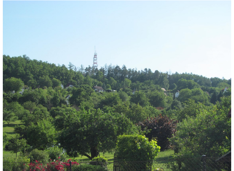
Kolonie pod Šibeničním vrchem

Šibeniční vrch I, Šibeniční vrch II - Největší komplex zahrádek v blízkém okolí Strakonice. Rozkládá se východně a severně pod vrchem Šibeník a je ohraničen Radomyšlskou silnicí a silnicí Strakonice-Droužetice. Atraktivní lokalita s pěknými výhledy do údolí řepických rybníků a na Radomyšlsko. Území je z větší části ve svahu, ale poměrně dobrá cestní síť a tedy i dostupnost umožňuje společně se změněným regulativem přestavbu a výstavbu objektů na trvalé bydlení. Přesto si část osady prozatím zachovává svou původní formu s podlouhlými pozemky a typizovanými rekreačními chatkami. Na místě však již vzniklo několik honosných staveb, které narušují celkový ráz území. Je pravděpodobné, že tento trend bude pokračovat. V západní části území bylo v posledních letech rozprodáno několik nových parcel zemědělské půdy.