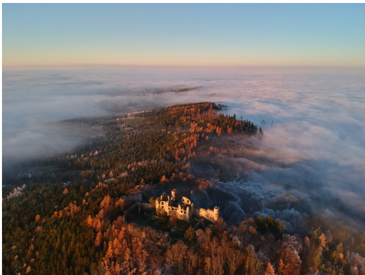
Hrad Helfenburk z dronu, foto Pavel Křížek

Fotky z víkendových výprav a z pozorování východů slunce zveřejňuješ pravidelně na svém facebookovém profilu . Často své reporty doprovází úžasnými záběry z dronu. Jak se Ti daří tohohle časově náročného koníčka kloubit s prací a ostatními aktivitami?