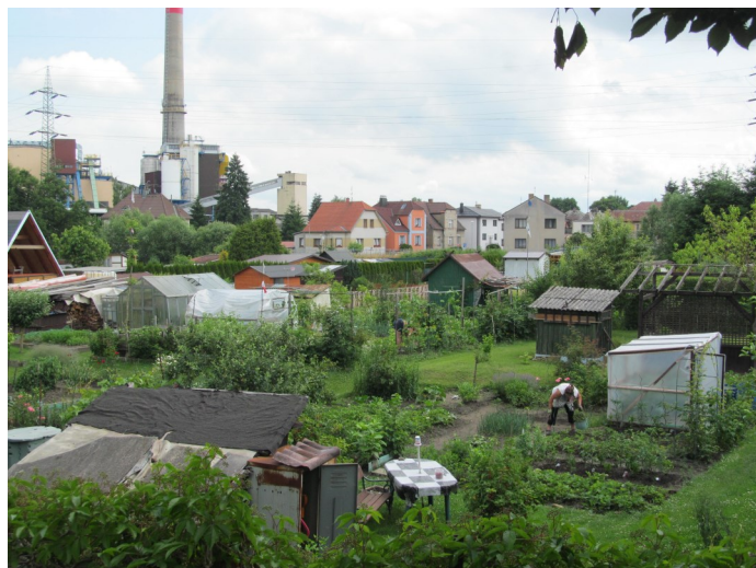
Osada Barvínek

Prácheňská - Menší osada rozkládající se v pásu mezi řekou Volyňkou a silnicí Strakonice-Radošovice s typickým podlouhlým tvarem pozemků.