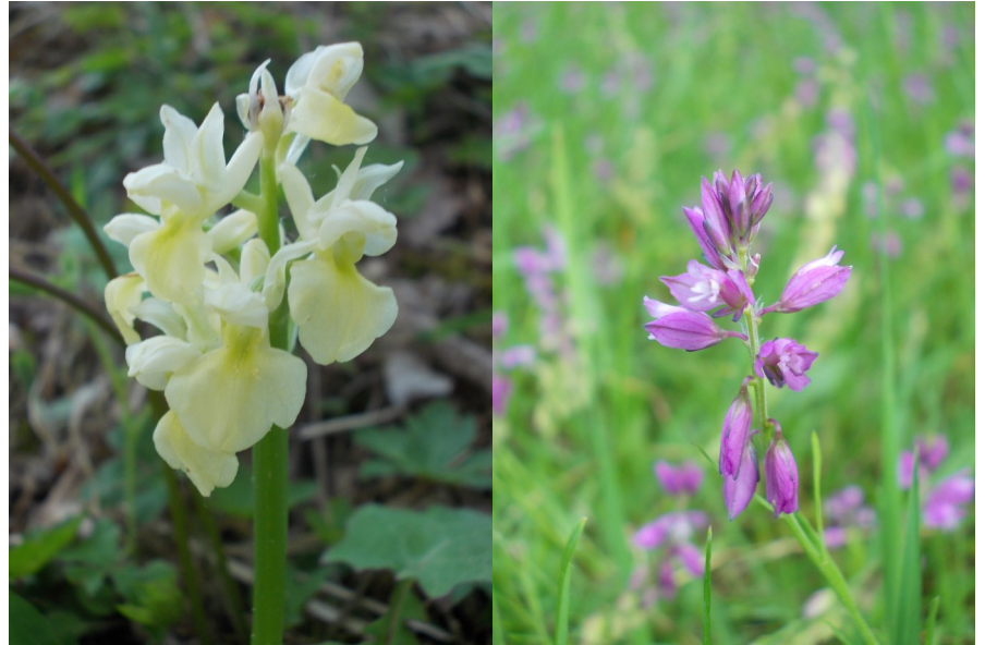
Vstavač bledý, kruštík tmavočervený

Mezi poli posléze dojdeme k severovýchodnímu cípu dalšího lesa, který se nazývá Slíďová a pokrývá stejnojmenný kopec o nadmořské výšce 494 metrů. Nyní už budeme pokračovat pro změnu lesní cestou, po níž se dostaneme až na vrcholek. Samotný les, skrze nějž půjdeme, nás pravděpodobně moc nenadchne. Především na severním svahu je momentálně ze značné části vykácen a na mnoha místech se stále povalují hromady odřezaných větví. Na jižní straně je sice v podstatně lepším stavu a celistvější, avšak jeho druhová skladba také není ničím zvláštní. Opět se nacházíme v běžném hospodářském lese s převládajícími borovicemi. Bylinné patro tu reprezentuje několik druhů lesních trav, dále violky, sasanky lesní a zimozrázek alpský (ve větší míře hlavně na vrcholu a v jižní části kopce). V