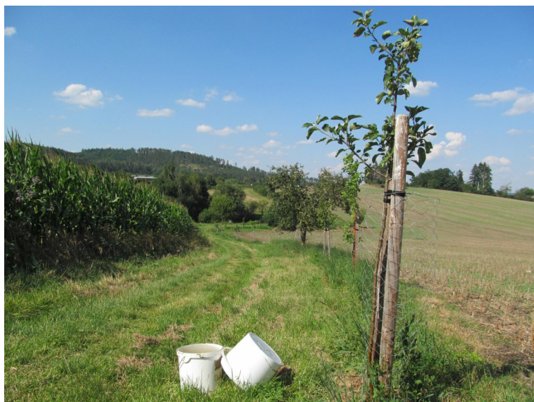
Zálivka ve Štafetové aleji 2

2018 - Na podzim tohoto roku naše organizace asistovala při dvou výsadbách zhruba stovky ovocných stromů starých odrůd a jedlých keřů u Zahorčic ( zde ). Do dnešního dne je v plné kondici zhruba 80 % výsadby i přesto, že bylo pouze obnovováno oplocení. Výpadky byly doplněny novými sazenicemi.