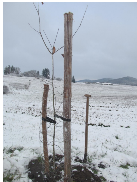
Poslední letošní dosadba, foto -jj-

Přes všechny tyto útrapy jsou ale výsadby stromů a alejí do krajiny jednou z těch činností ve prospěch přírody, které přinášejí mnoho potěšení a také nových poznatků. Samozřejmě, že není vhodné sázet vždy a všude, ale zejména stromořadí, která dokáží nějakým způsobem rozčlenit monotónní zemědělské bloky nebo přispět k obnově zaniklých polních cest, jsou ty nejhodnotnější. -jj-