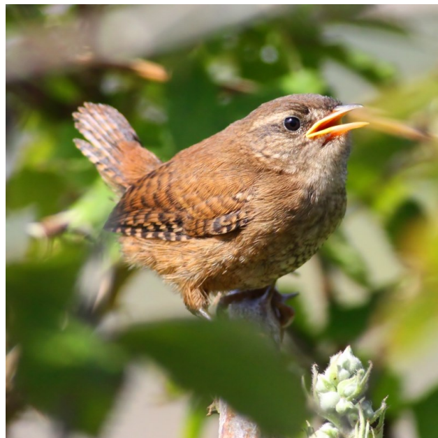
Střízlík obecný

V knížce „Ptáčkové“ se jeho výtvarný projev trochu odlišuje, stejně tak jako veršovaný text. Obojí je přizpůsobené malým dětem a má hlavně přilákat pozornost, okouzlit a inspirovat k zapamatování. Autor se přitom dokázal ubránit podbízivosti a nevkusu. Jednotlivé charakteristiky našich ptačích kamarádů můžete přečíst dětem jako hádanky, a protože opravdu věrně vystihují vlastnosti toho kterého opeřence, jsou jak zábavné, tak i poučné. Zaujmu i dospělé, jak jsme si ověřili 22. 8. 2023 při programu „Úterní zastavení“, které se konalo na pobočce Za Parkem. Tématem byly tentokrát právě hádanky. Knížek k nahlédnutí bylo několikero a „Ptáčkové“ patří k těm, které se líbily nejvíc. -ah-