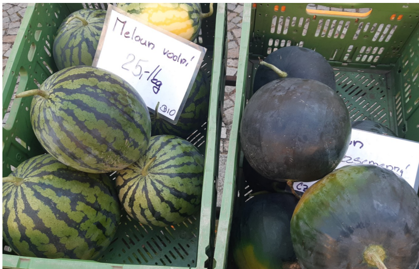
Melouny regionální produkce na farmářských trzích

Pokud navštívíte během parného léta jakékoli větší sídlo, brzy zjistíte, že existují dvě věci, bez kterých si Češi tuto část roku představit nedovedou. První z nich jsou stánky se zmrzlinou, druhou pak melouny. Meloun je tak neodmyslitelně spjatý s pohodovým časem horka a dovolených, že jej přidáváme k letním nákupům zcela automaticky. Zamysleli jsme se však někdy nad tím, jak velká ekologická stopa se za tímto produktem skrývá? Pojďme si to trochu přiblížit.