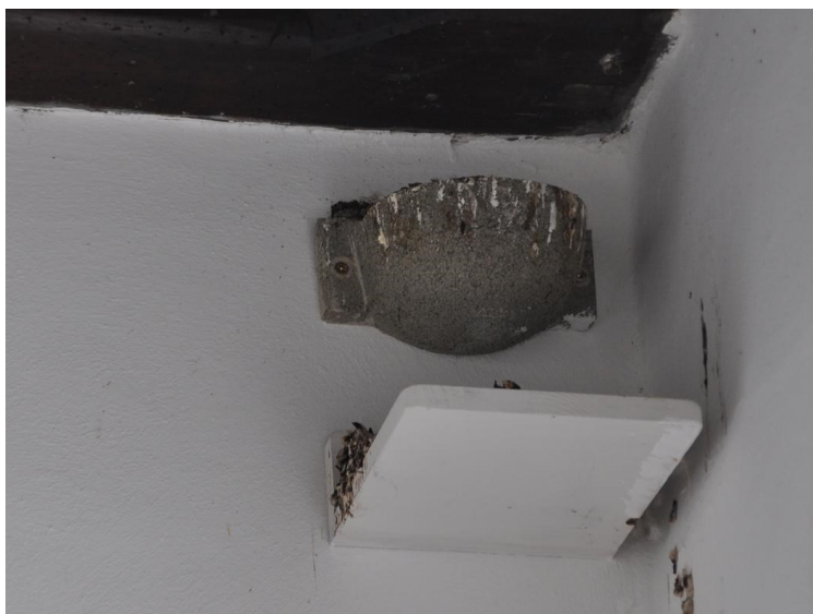
Umělé hnízdo pro vlaštovky, foto Vilém Hrdlička

A teď jedno velké překvapení: představte si, že rorýs a vlaštovka nejsou blízcí příbuzní! Někdo z vás to