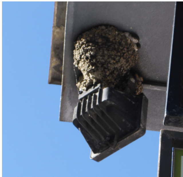
Hnízdo jiříček

• O něco menší než vlaštovky jsou jejich příbuzné jiříčky. Trochu se liší i zbarvením (hlavně bílou skvrnou nad ocáskem) a výrazně kratšími ocasními rýdovacími pery. Hnízda nemají miskovitá jako vlaštovky, ale více uzavřená, s vletovým otvorem. Stavějí si je také u lidí, ale jen zvenčí ve výklencích, pod římsami a podobně. Mimo dobu hnízdění nocují společně na strozech. Běžně se s nimi setkáváme i ve městech. Můžeme pro ně i něco snadného udělat – udržovat vlhké hlinité místo k nabírání stavebního materiálu pro hnízda. A hlavně: mít pořád na mysli to, co je jasné jiříčkám i všem ostatním divokým tvorům, ale mnohým lidem to nedochází - že naše planeta tu v žádném případě není jen pro lidi a že je nutné dělat všechno pro to, aby společné soužití bylo co nejlepší (viz např. tipy na webu České společnosti ornitologické, v příslušném dílu výborného pořadu „Ornitolog na drátě“, blogu Zelená domácnost atd.). Kdo rozestavěná (nebo dokonce i hotová!) hnízda jiříček ze svého domu shazuje, myslí jen na své pohodlí. A přitom to jde zařídit tak, aby řešení bylo přijatelné pro všechny zúčastněné. Tedy, když nepočítáme hmyz, který se musí mít na pozoru před ulovením, místo aby si pěkně létal, kde se mu líbí... V našem časopisu už na tohle téma hned v prvním jeho ročníku vyšel pěkný článek od Jana Juráše – viz číslo 7/2012 .