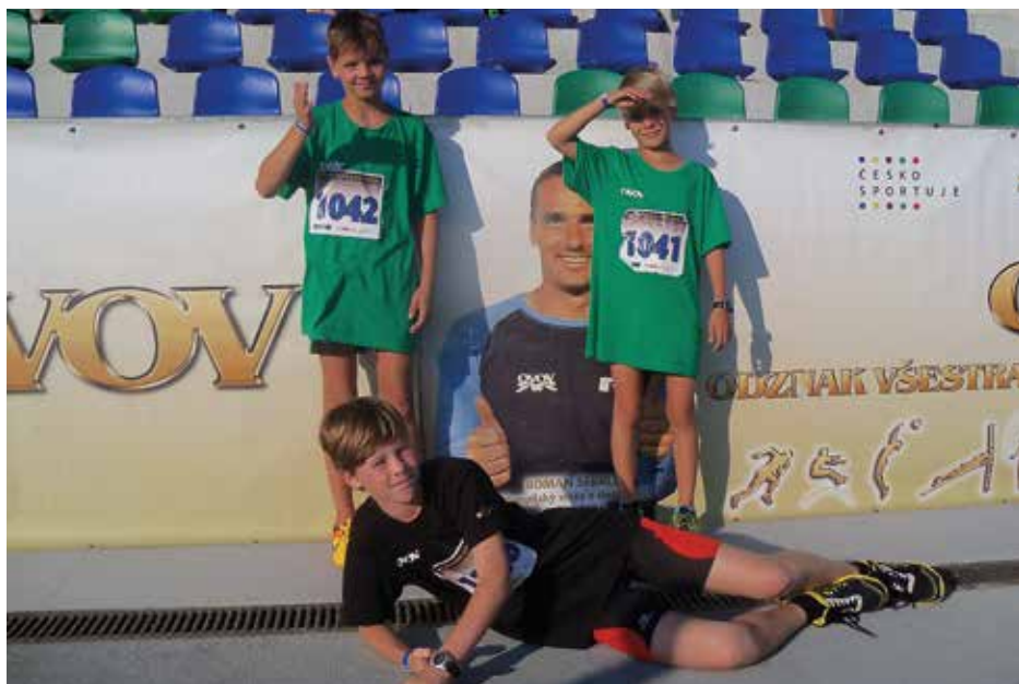
Trojice zástupců ZŠ Jiřího z Poděbrad podala skvělé výkony