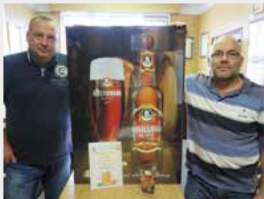
Ředitel pivovaru se sládkem

Na letošním 59. ročníku žatecké Dočesné Klostermann opět bodoval a do strakonického pivovaru přivezl ocenění z prestižní degustační soutěže v kategorii polotmavá piva, o které Měšťanský pivovar Strakonice rozšířil svou sbírku. Nepasterovaný polotmavý ležák s obsahem alkoholu 5,1 % obj. obsadil báječné třetí místo.