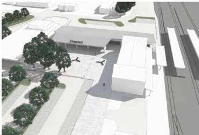
Vizualizace nového přestupního terminálu

Pokud máte zájem blíže se seznámit s plánovanými úpravami přednádražního prostoru ve Strakonících, rádi vás uvítáme na veřejném projednání, které se uskuteční 20. října od 16.00 hodin v kulturní domě.