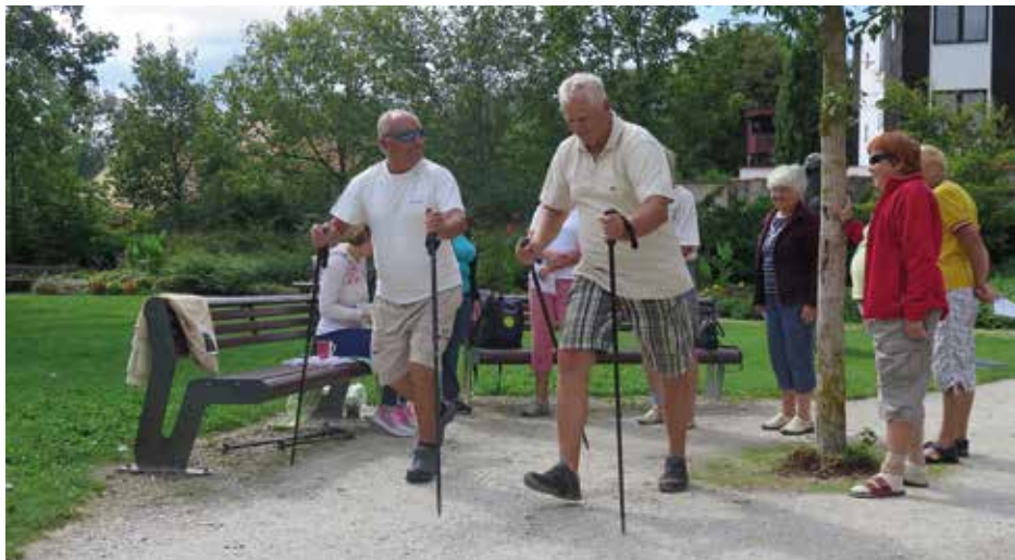
Jednou z disciplín byl nordic walking