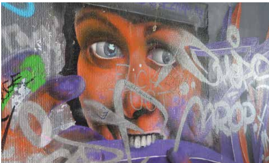
Grffiti v podchodu u pivovaru