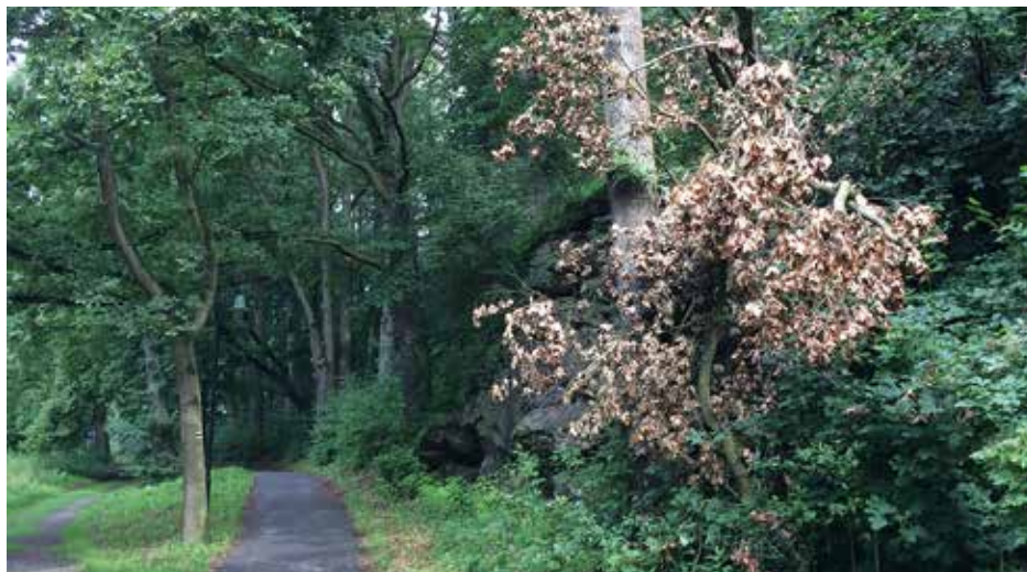
Spadlý strom na Podskalí