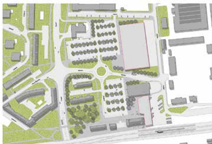
Celková situace nové podoby přednádražního prostoru