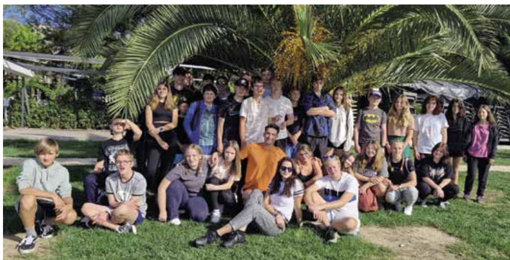
Žáci ZŠ Dukelská ve Slovinsku

do Rakouska, Polska, Německa, Beneluxu či Dánska jsme se rozhodli navštívit nejvyspělejší zemi bývalé Jugoslávie, Slovinsko.