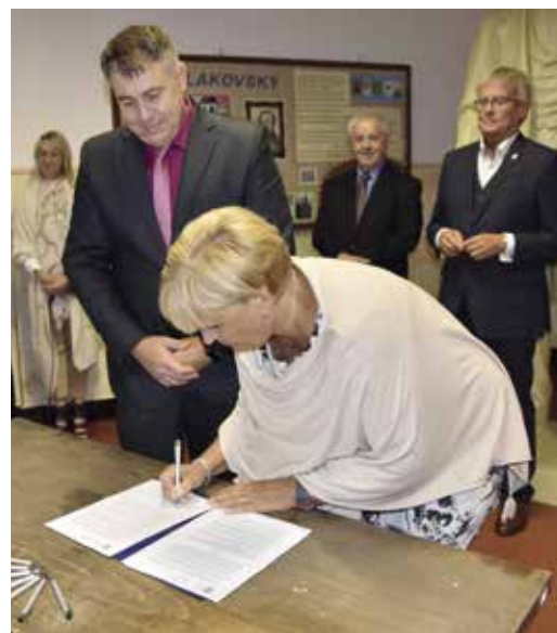
Podpisy stvrzující vzájemnou spolupráci