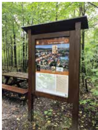
Informační cedule na Šibeničním vrchu

Hledáte inspiraci pro podzimní procházky? Vydejte se po stopách místní dudácké tradice a dudáka Švandy. Dvanáctikilometrový okruh neminete díky žlutým pěším turistickým značkám.