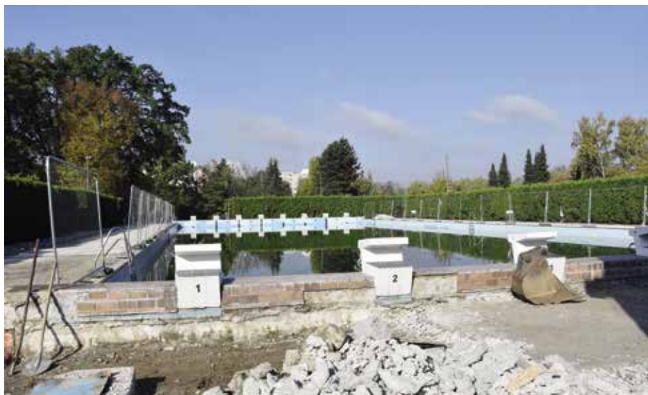
Ze stavby nafukovací haly