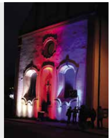
Kostel sv. Markéty nasvícen do barvy trikolory

V 17:30 hodin začíná v kostele bohoslužba s díkem i prosbou za svobodu a následně u kříže modlitba.