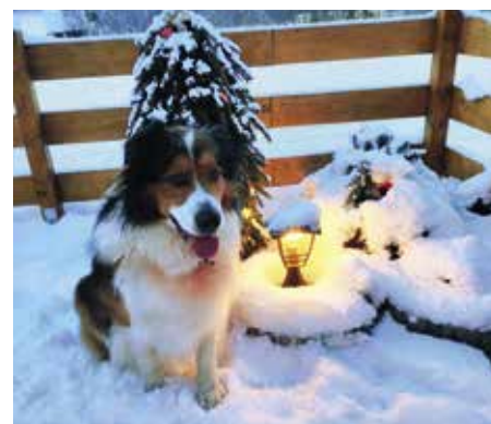
Nezapomeňte za mě zaplatit

Výše poplatku se nemění, zůstává na úrovni roku 2021. Veškeré potřebné informace k poplatku za psy podá Petra Šmolíková, tel.: 383 700 520, e-mail: petra.smolikova@mu-st.cz .