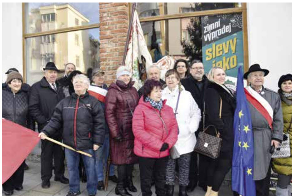
Sto třicet let uplynulo od narození Josefa Skupy