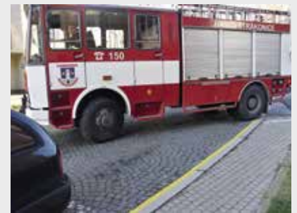
Ilustrační foto a text: Markéta Bučoková

Dopravní komise doporučila v rámci zachování obslužnosti a na základě projednání problematiky zákazu parkování před požární zbrojnicí v Sokolovské ulici o doznačení prostoru vodorovným dopravním značením V12a „Žlutá klikatá čára“.