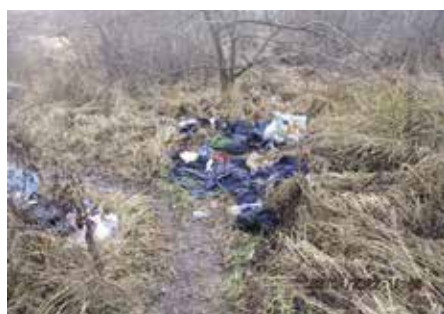
Cestou z Mírové ulice na Jezárky

Městská policie hlásí veškeré komunikační závady technickým službám, které se snaží maléry okamžitě řešit. Do komunikačních závad patří celá škála záležitostí – nepořádek v kontejnerových hnízdech, zničený mobiliář, ohnuté či vyvrácené do-