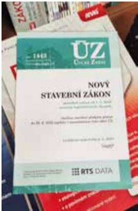
Ilustrační foto

V roce 2022 začíná platit část nového stavebního zákona (č. 283/2021 Sb.), který by měl nabýt plné účinnosti až 1. 7. 2023. Zákon obsahuje zásadní změny (zkrácení