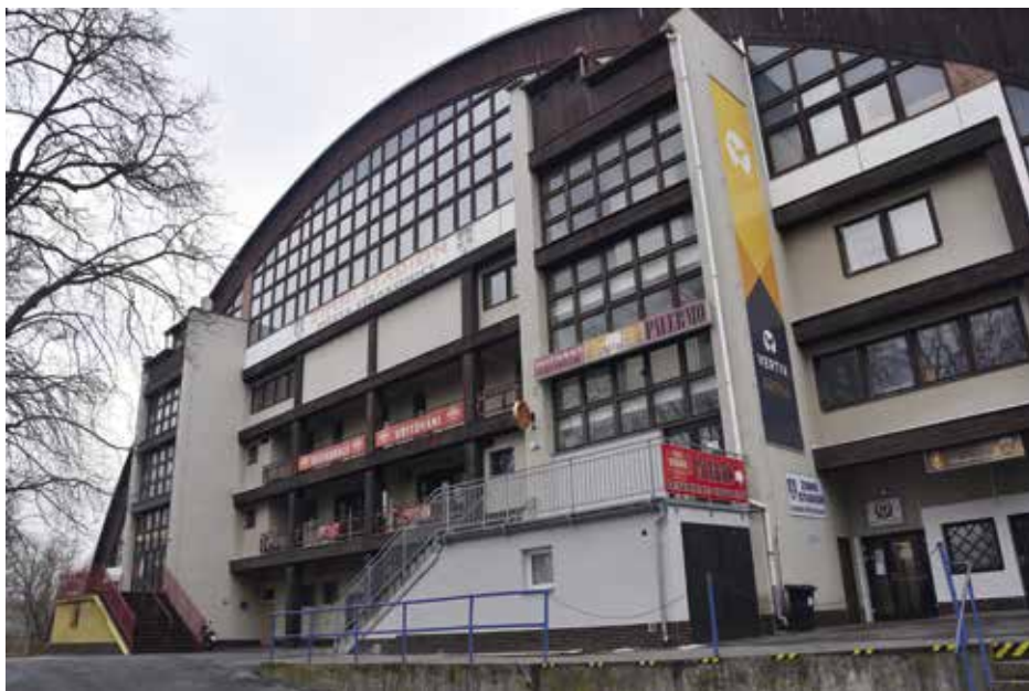
Obnovou projdou obě ramena schodiště