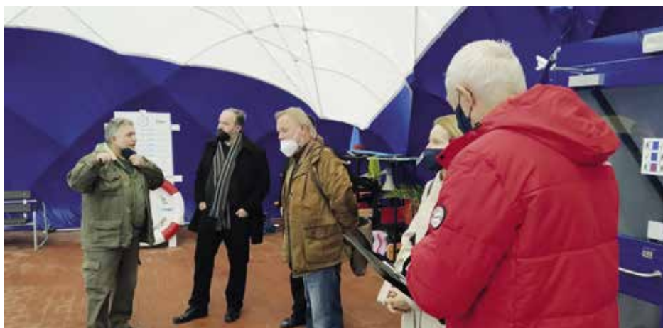
Návštěva kadaňské nafukovací haly