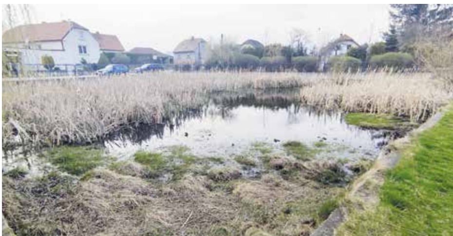
Stávající stav nádrže na Virtu

Předmětem opravy bude stávající betonová zídka na východní a jižní straně nádrže, která je již ve velmi špatném technickém stavu. Dále bude nutné nádrž odbahnit. Sediment bude odvážen na říze-nou skládku. Jakmile bude nádrž odbahně-