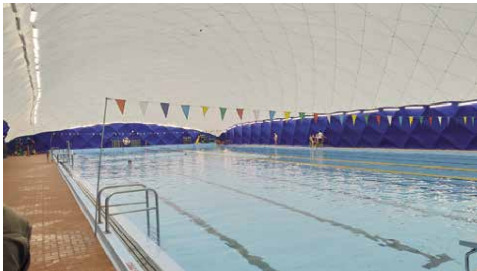
Nafukovací hala v Kadani