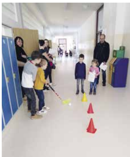
Z oslavy školy

„Povážská“ si prožila nejen několik let typicky školních, ale i dva roky covidové, což nebylo vůbec jednoduché. Když už se zdálo, že toto méně šťastné období končí, přišla do toho nelehká doba spojená s válkou na Ukrajině. Právě proto bychom si měli vážit každých ne zcela samozřejmých maličkostí všedního dne, každého pocitu štěstí, oslavovat malé i velké události. Oslava otevření