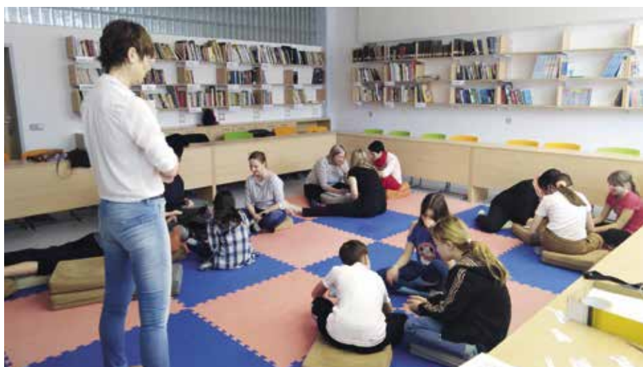
Nová forma výuky podchytili i nečtenáře

Rodiče nejdříve dostali pozvánku s pokyny, že si mají přinést vlastní knihu (rozečtenou nebo tu, kterou chtějí začít číst). Na začátku lekce jsem jim představila učebnu dílny čtení – místnost, která je k tomuto účelu přímo určena, je vybavena nejen knihami rozdělenými do jednotlivých žánrů, ale i podložkami, polštáři, aby děti měly při