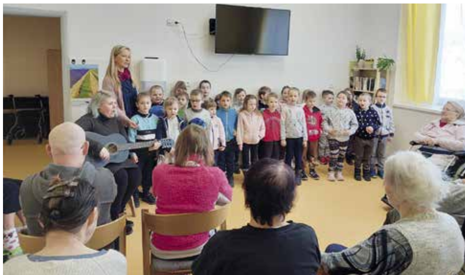
Děti svým zpěvem zpříjemnily den seniorům