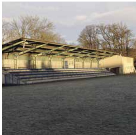
Tribunu Na Křemelce čeká rekonstrukce

Veřejnosti určitě neušla aktuálně prováděná rekonstrukce travnatého fotbalového hřiště Na Křemelce. O tu se postaral sportovní klub FK Junior Strakonice, který na její provedení obdržel dotaci od Národní sportovní agentury ve výši