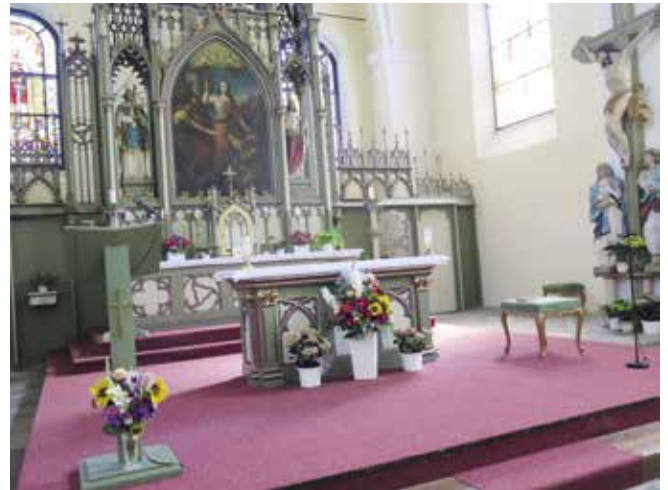
Ambon v kostele sv. Markéty

Mimořádné místo má pro věřícího v životě Boží slovo, které čteme z Bible. Proto je v kostele ambon, který není mimořádný svým tvarem – v dějinách se jeho provedení vyvíjelo především s ohledem na to, aby bylo z tohoto místa dobře slyšet. Dnes je to většinou zdobenější pult uzpůsobený k předčítání. Zásadní hodnota není ve vzácnosti materiálu, z něhož je vyroben, ale v poselství, které od něj zaznívá. Věříme, že v biblických textech i dnes promlouvá Bůh a my se mu učíme porozumět. Od ambonu čteme pouze Písmo svaté (nemá se používat