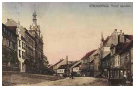
Strakonice, Velké náměstí, hotel Černý orl, 1920, nakl. A. Hrdlička

Mezi hostince patřily i objekty v Nových Strakonicih vedené pod čísly popisnými 26, 28 a 29. Dohromady byly označovány U Bílého vlka. Nemovitosti měly dobře zvolené umístění. Setkávaly se tady dvě dopravní tepny z hlavních tříd Zátkovy a Komenského. V domě číslo 29 se provozovala vyhlášená hostinská živnost. Konaly se zde pravidelné taneční zábavy a jiné kulturní akce. Dům číslo 28 byl jednopatrový a sloužil pro ubytování hostů. Dům číslo 26 byl využíván především jako stodola. Mezi objekty se nacházelo velké zahradní posezení