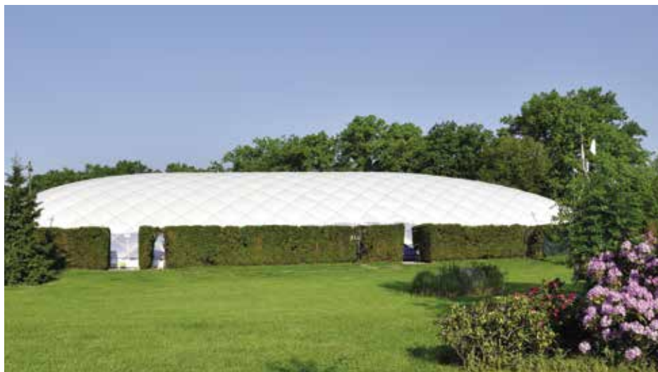
Nafukovací hala rozšíří nabídku využití areálu