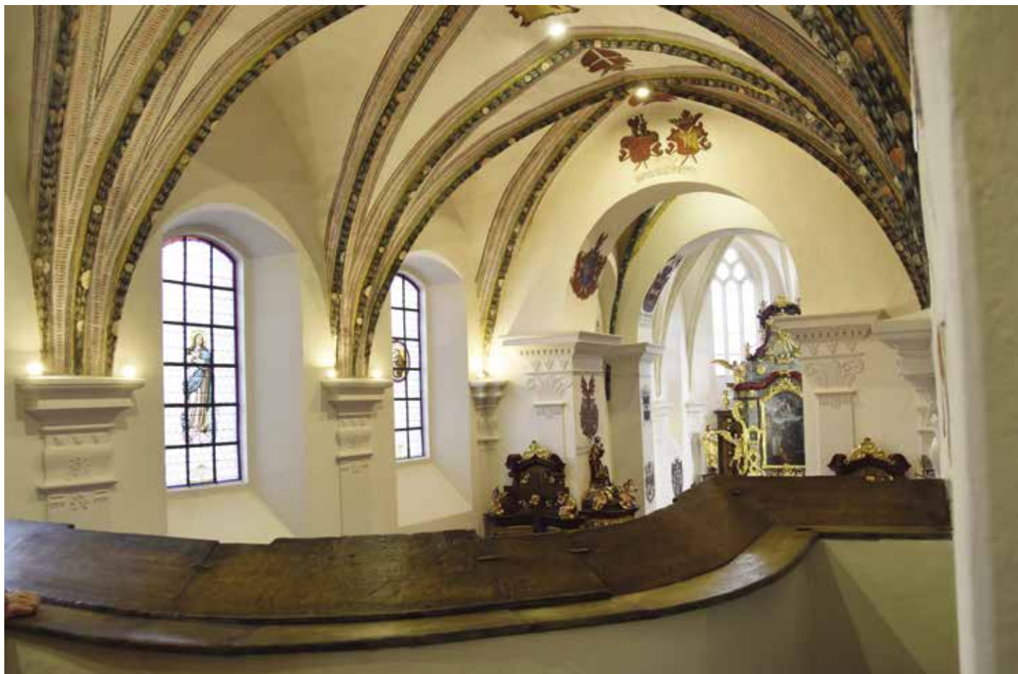
Vitráže v kostele sv. Prokopa