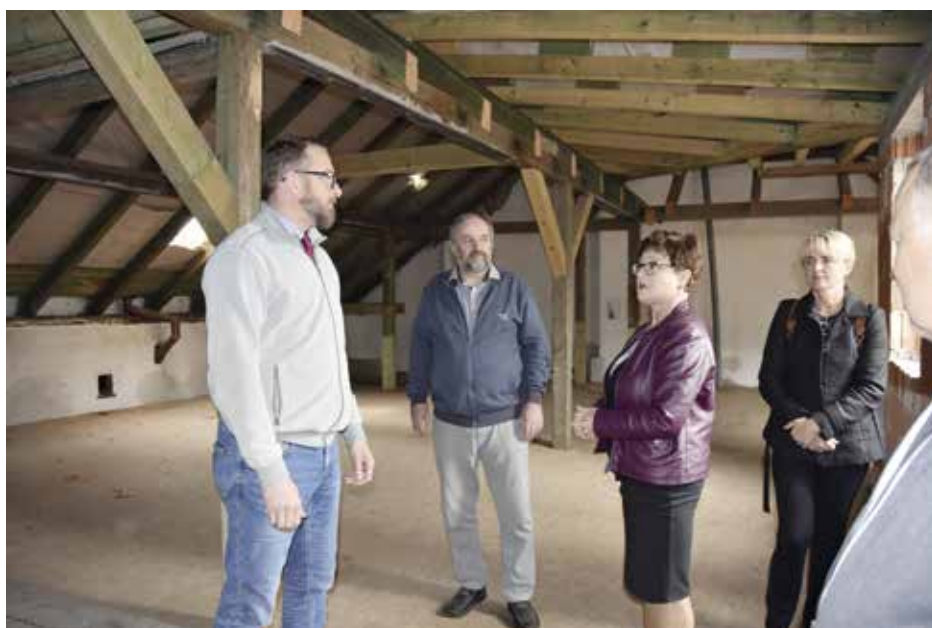
Společné setkání v prostorách bývalé školy Revoluční

„Zástupcům z kraje jsme podali veškeré možné informace týkající se samotné budovy. Vyhodnocení možnosti přesunu a rozšíření je nyní na rozhodnutí kraje. Zda bude zájem využít naši budovu, se dozvíme v průběhu následujících týdnů. V případě kladného výsledku by mohla započít oficiální jednání,“ sdělil místostarosta Oberfalcer.