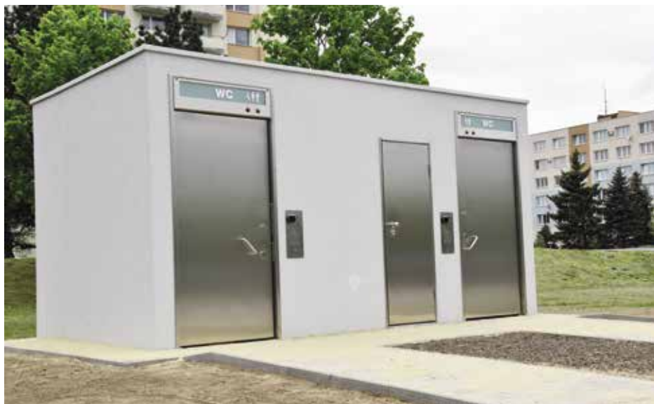
K předání toalet došlo 19. května

Další automatická městská toaleta byla předána do užívání v pátek 19. května. Nachází se v centrální části města v lokalitě Pod Hvězdou. Stavbu realizovala na základě soutěže strakonická firma Prima, a. s. Toaleta bude celoročně využitelná a přístupná v jakoukoliv denní dobu, jen v čase od 22. do 6. hodiny ranní bude z důvodů bezpečnosti uzavřena. Její použití vyjde klienta na pouhých 5 korun. Platbu bude možné zrealizovat v hotovosti nebo prostřednictvím platební karty.