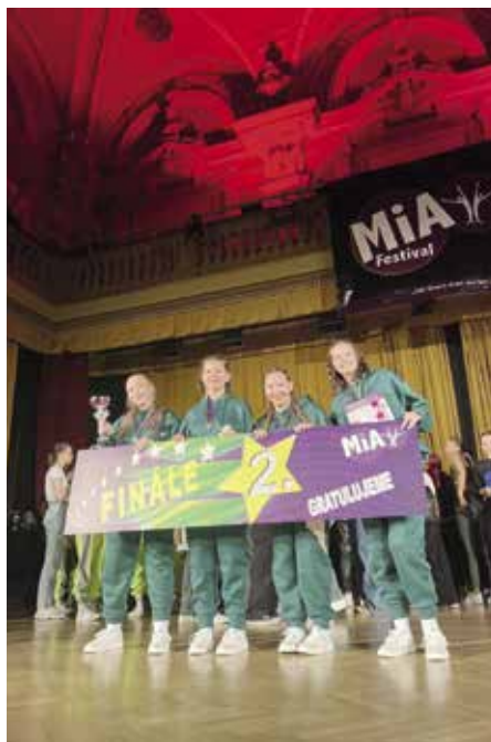
Z republikového finále soutěže Mia Festival

Více o dalším mimořádném úspěchu děvčat z DDM Tereza Koutenská: „Do finále v Národním domě na Vyno-