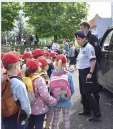
Děti zaujala práce policie

Hádanky, závody na koloběžkách, skákání v pytli, zábavné kvízy, přetahovaná, ukázky práce policejního psa, vybavení hasičského auta nebo pomůcky k odchytu zvířat, to vše měly děti možnost vidět a vyzkoušet na akci, kterou každým rokem připravuje Odbor dopravy Městského úřadu Strakonice ve spolupráci s Městskou policií Strakonice pro předškoláky místních mateřských škol. Jejím cílem je zábavnou formou seznámit děti s prací jednotlivých složek integrovaného záchranného systému. Na jedenácti stanovištích na děti čekaly úkoly a po jejich splnění i sladká odměna.