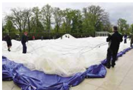
Postavit halu znamená zaměstnat 35 párů rukou