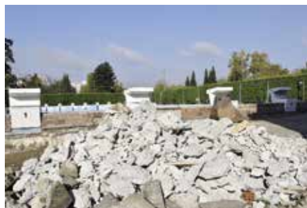
Realizaci haly předcházely bourací práce

Město i vedení STARZu tímto všem děkuje za jejich pomoc, díky níž se od září můžete těšit na rozšířené plavání.