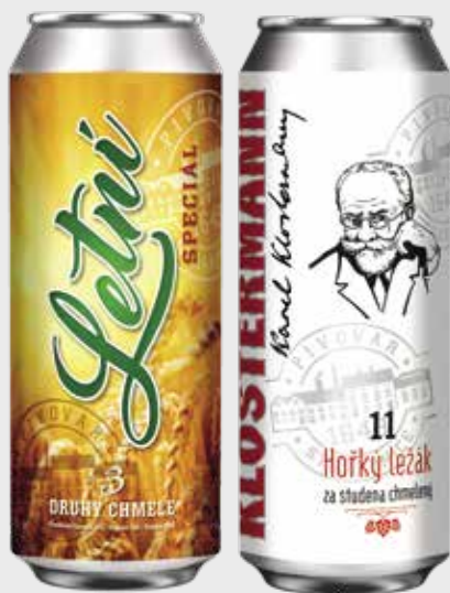
Klostermann a Letní special v plechu

Pivovar Strakonice 1649 má pro své zákazníky novinku – vybrané druhy piv stáčí od poloviny června do plechovek, které jsou dlouhodobě silně rostoucím segmentem napříč pivovarským trhem. Ať vám Klostermann a Letní special dělají na dovolených skvělou společnost. Dej Bůh štěstí.