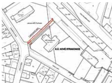
Celková situace stavby

V ulici Holečkova, před dvěma mateřskými školami, zoufale chybí parkovací místa. Ranní