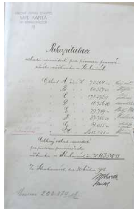
Rekapitulace majetku pivovaru 1912

s kuželnou, které vyhledávali jak obyvatelé ze Strakonice, tak i z přilehlého okolí.