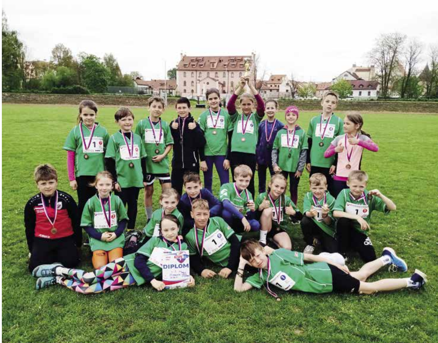
Hruď sportovců ze základní školy Krále Jiřího z Poděbrad zdobí bronzová medaile