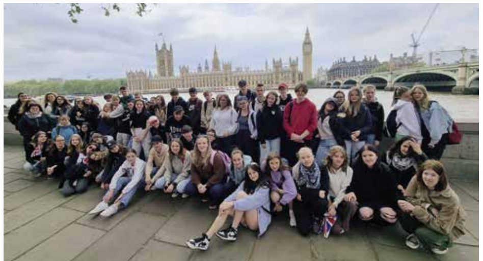
Deváté ročníky prověřily znalosti v Londýně

Zaujmut a nadchnout ty starší bývá někdy náročnější. Žákovský dotaz „A k čemu mi to v životě bude?“ zná snad každý. Ukázat žákům, jaký benefit přinese do jejich života dobré ovládnutí cizího jazyka, je tedy zásadní. Proto... Angličtina v praxi aneb Ověř si, jak