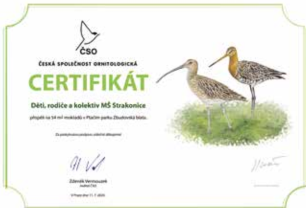
Mateřská školka obdržela certifikát za sbírku na založení ptačího parku.

Dětství je nejdynamičtějším obdobím našeho života. Dětské tělo se vyvíjí a vše v něm roste. Nic se neděje jen tak náhodou. Všechno má svůj smysl a řád. Víme, že každé semínko, které v dětech zasejeme, postupem času roste a sílí. Semínko „lásky a úcty k přírodě“ je jedním z nejdůležitějších. V předškolním