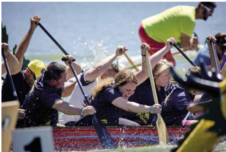
Draci Strakonice v akci

Tento druh sportu je vhodný pro široké věkové spektrum zájemců. Od malých, jak sami Draci říkají, „špuntů“, až po dospěláky 70+. Jsou otevření novým členům, které mezi sebe do jejich doslova široké náruče