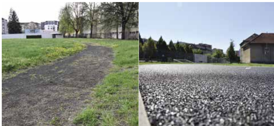
Atletický ovál před a po rekonstrukci