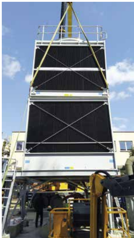
Nová chladicí věž

V červenci se uzavřela jedna historická kapitola fungování teplárny. Teplárna úspěšně uzavřela svůj chladicí okruh turbíny TG2,