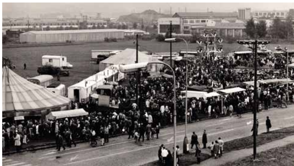
Strakonická pouť po roce 1948

Hlavními místy, kde se celý mumraj lidí potkával, byly Dubovec a Ohrada. Na Dubovci rozkládali své zboží prodejci