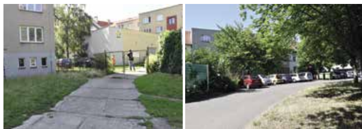
Přilehlá ulička se dočká rozšíření a opravy

V těchto místech vznikne 7 nových kontejnerů