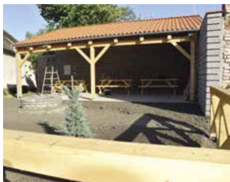
Rekreační pergola na prostranství osady Střela

Plánované výměny oken i celková revitalizace atletického oválu přinesou do následujících dnů o mnoho lepší prostředí, než bylo doposud. Na celé jižní straně budovy školy byla vyměněna stará dřevěná okna za plastová, souběžně s tím se v další etapě měnila elektroinstalace v suterénu, bezbariérový výtah, který dosloužil a bez něhož se škola neobejde. Určitě, zvláště pro