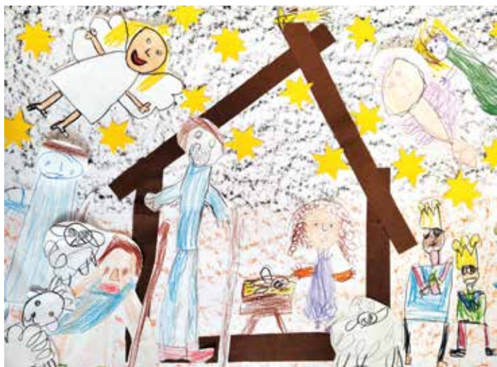
Kolektivní práce - Měďové