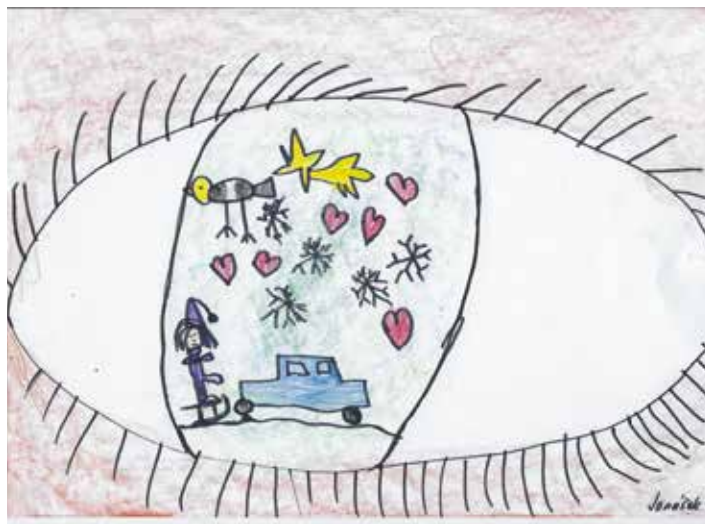
Jonáš Bradáč, 5,5 roku