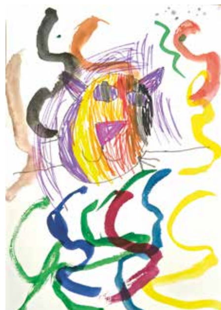
Lucie Svobodová 4,5 roku, MŠ Holečkova