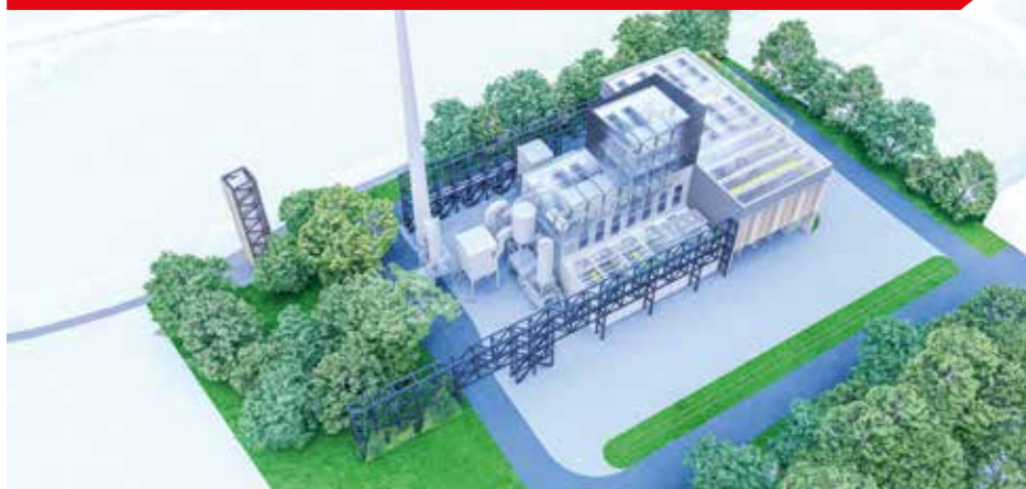
Vizualizace objektu ZEVO, Ing. arch. Vladimír Zajíc

Jak možná mnozí občané již vědí, město Strakonice má zájem ve spolupráci s městem Písek vybudovat zařízení pro energetické využití odpadu, tzv. ZEVO, u Teplárny Písek. Plán na výstavbu souvisí se zákazem skládkování energeticky využitelných odpadů od roku 2030 i odklonem od spalování fosilních paliv.