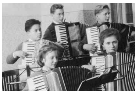
Soubor harmonikářů 60.-70. léta