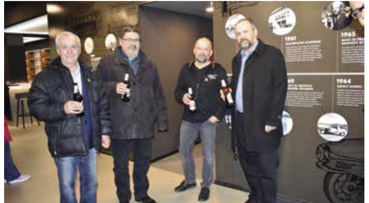
Slavnostní otevření