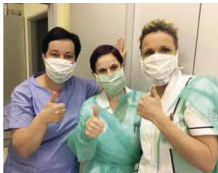
Zdravotníci v darovaných rouškách.

Existuje řada prostředků, které samozřejmě pomohou zabránit šíření viru, jde o roušky, šátky, respirátory, rukavice, čepice a ochranné oděvy. Jejich účinnost se odvíjí od vlastností pomůcky a způsobu zacházení s nimi. Zatímco rouška zpomaluje šíření viru od nemocného pacienta, respirátor FFP3 je určen společně s dalšími ochrannými pomůckami pro zdravotníky, kteří o nemocného pacienta přímo pečují. Je jasné, že způsob chování a používání ochranných pomůcek se odvíjí hlavně od různé situace (procházka na odlehlém místě, jízda MHD nebo návštěva nákupního centra). Nosit