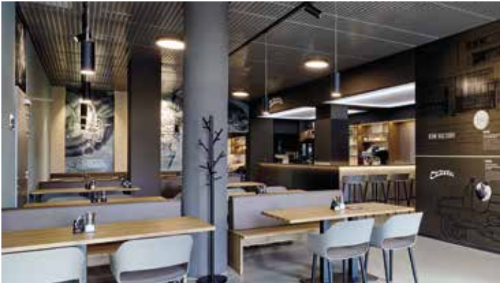
Interiér nové restaurace