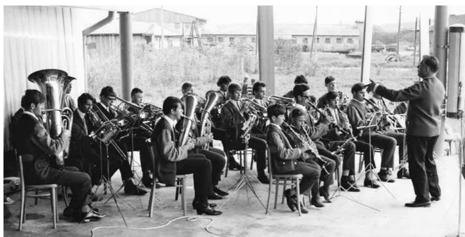
Dechový orchestr školy