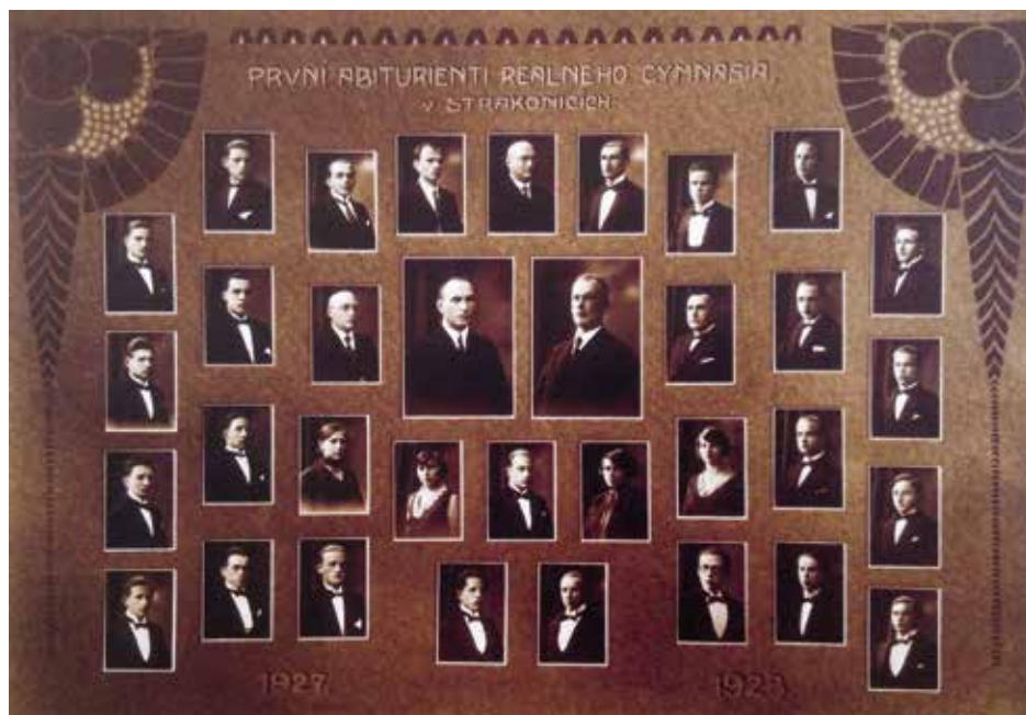
První maturanti gymnázia - školní rok 1927/1928