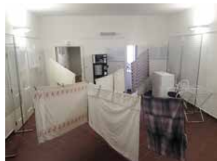
I takto se dá využít foyer

místa roušek a materiálu na roušky – tzv. rouškobudky. Jsou to vyřazené telefonní budky, které máme v majetku a postupně je chceme přetvořit na knihobudky. Každý den jsme rouškobudky objeli, sbírali nashromážděný materiál, vybrali látky vhodné na šití roušek a v knihovně je pak vyprali a usušili. Pak jsme vše předávali na hlavní sběrné místo zřízené na služebně městské policie, odkud si materiál rozebíraly dobrovolné švadleny. Poptávka ovšem nebyla jen po látkách, těch se shromáždilo poměrně hodně, spíše chyběly tkalouny a gumičky.