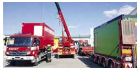
Instalace odběrového místa

I když v souvislosti s vládními opatřeními došlo k utlumení výroby, obchodu a volného pohybu obyvatelstva, nikterak se tato skutečnost neprojevuje v naší zásahové činnosti. V období od 10. března do 17. dubna v rámci okresu evidujeme 72 událostí. Z toho je 12 požárů (škoda 147 tisíc korun, uchráněné hodnoty za 300 tisíc korun), 14 dopravních nehod a 36 technických zásahů. Tyto počty jsou téměř totožné jako ve stejném období minulého roku, není zde žádný významný pokles.