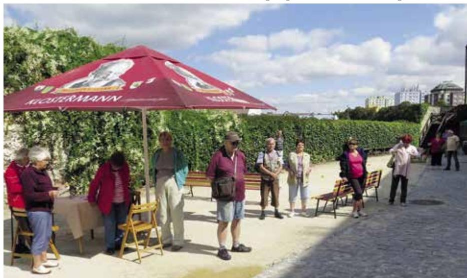
Mimořádná situace neumožňuje pořádat akce pro seniory