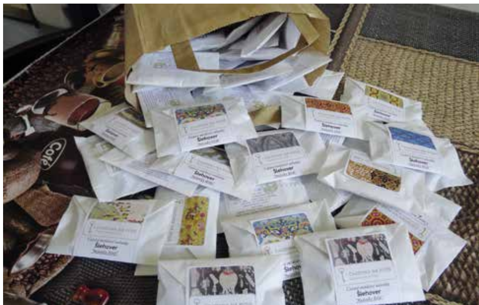
Darované sušenky s citáty