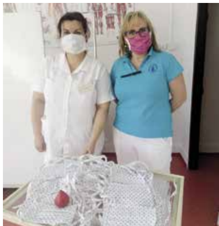
Roušky pro interní hematologickou ambulaci

V době, kdy vzniká tento článek, se Strakonice potýkají s koronakrizí již osmý týden. Za ten čas se z vás stali odborníci na výrobu roušek, znalci dezinfekcí, dobrovolníci, lidé s otevřeným srdcem a podanou pomocnou rukou. Obrovská vlna solidarity, jaká se dokázala vzdemout, aniž bychom k tomu potřebovali zástup krizových manažerů, je důkazem toho, jak si v těžkých chvílích dokážeme sami pomoci.