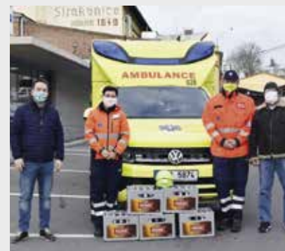
Zástupci pivovaru se záchranáři

V dnešní době to není o musíme, ale o prostém chceme. Těžko mluvit za národ, ale jako Strakoničtí jsme se doslova semkli a ochota pomoci se nese napříč celým městem, a kdo má jen trochu možnost, neváhá podat pomocnou ruku.