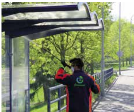
Speciální údržba zastávek provedena

Technické služby Strakonice, s. r. o., ve spolupráci s odbornou firmou Greenroot, s.r.o.,