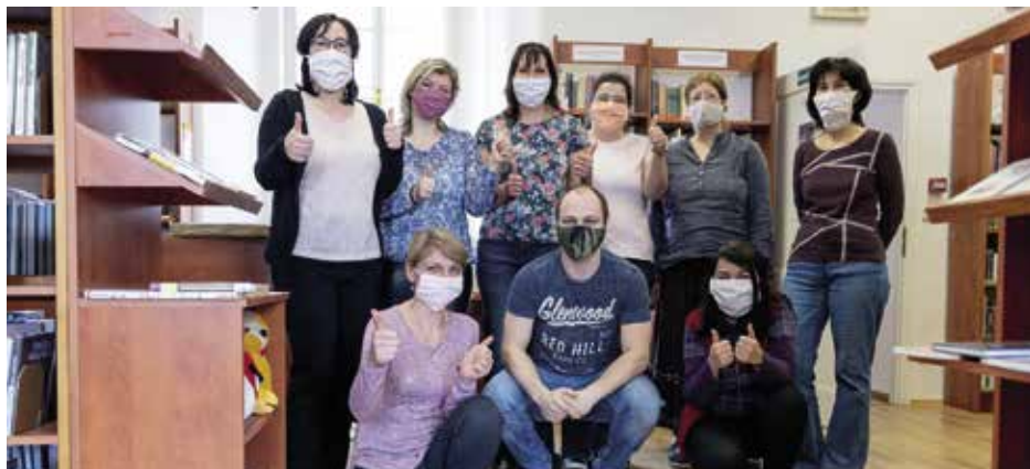
Tým, který mezi knižními regály nezahálí