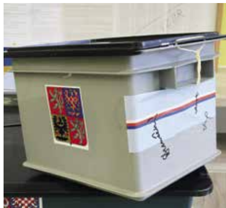
Přenosná volební urna