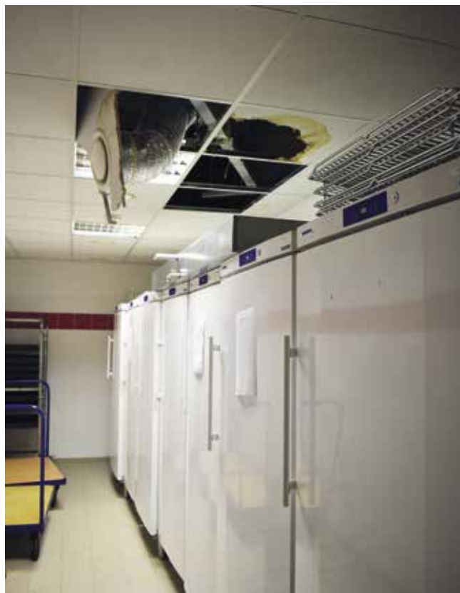
Poškozený strop ve školní jídelně ZŠ Povážská

Od samého začátku provází Základní škola Povážská jedna nepřijemnost za druhou. Nejprve se vedly dlouhé spory o tom, zda a jak velká škola se má postavit, nyní se pro změnu vedou vleklé soudní pře o kvalitě provedených stavebních prací. Město se domáhá reklamací za dodavatelskou činnost jednotlivých firem podílejících se na výstavbě této budovy.