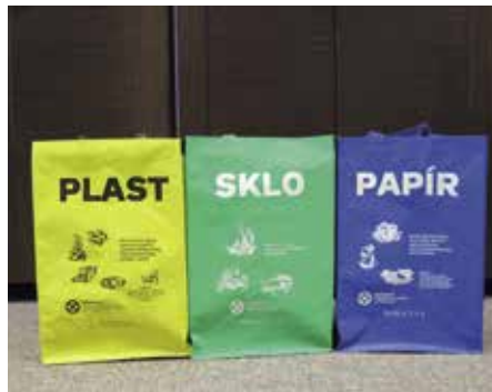
Tašky na tříděný odpad

Město Strakonice ve spolupráci se společností EKO-KOM, a.s., přichystalo pro své občany novinku, a to v podobě tašek na tříděný odpad. Strakoničtí tak mohou zapracovat na dokonalejším třídění odpadu. Pro jednu domácnost bude městský úřad poskytovat zdarma vždy jednu sadu tašek. Každá sada obsahuje 3 kusy opakovaně použitelných tašek na sklo, plast a tetrapak a na papír. Radnice rozdává tento rok 500 sad. K dispozici je 250 kusů 40 litrových sad a 250 sad o objemu 20l. Předpokládáme, že větší tašky si budou brát majitelé rodinných domů a menší jsou vhodné spíše do panelových bytů. Podmínkou pro předání sady tašek je prokázání trvalého pobytu ve městě Strakonice (občanský průkaz s sebou) a zároveň všichni členové domácnosti musí mít uhrazené veškeré poplatky za komunální odpad. Poplatek za komunální odpad pro tento rok měl být zaplacen do 30. 6. 2020. Kdo má o tašky na tříděný odpad zájem, musí se dostavit osobně na úřad, na odbor