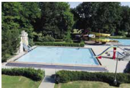
Vodní ráj pro děti

Před zprovozněním letního areálu rovněž proběhly nezbytné opravy a údržba venkovních bazénů. Odborná firma zrezovala keramické obklady stěn a ochozů jednotlivých bazénů, naši zaměstnanci se věnovali nátěrům, výmalbě a úklidu. Nově bylo nutno ještě narychlo nakoupit a připravit desinfekční prostředky.