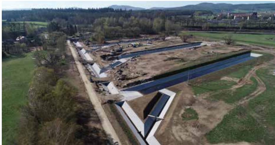
Rozsáhlá úprava prameniště