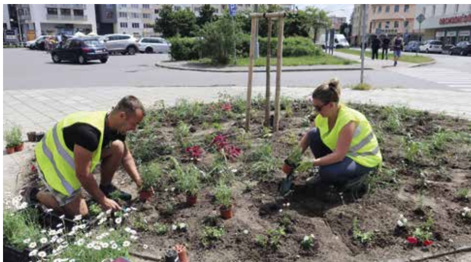
Rok dopředu je plánována skladba a barevnost každého záhonu