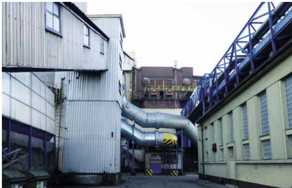
Modernizace současného zařízení zajistí ekologičtější provoz

V následující topné sezóně se také rozloučíme s některými odběrateli, které jsme v minulosti výrazně dotovali. Tento krok nám umožní zeštíhlené a efektivnější fungování společnosti a zároveň podpoří náš hlavní cíl, kterým je návrat hospodaření do černých čísel.