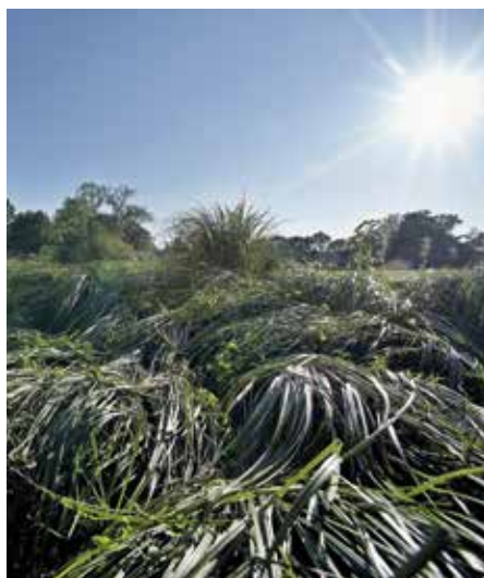
Vlhkomilná ostřice ve slepých ramenech řeky

Hlavním tématem současnosti je otázka, kterou řeší všechny obce v republice, a to je sekat, či nesekat trávníky a případně jak. Chceme-li opravdu zodpovědně přistoupit k tomuto tématu, musíme si jako první položit otázku, jak taková květnatá louka vůbec vznikla. Květnatá louka je jedním z výtvorů člověka a vznikla pravidelným sekáním. Pokud necháme travnatý pozemek v našich zeměpisných šířkách svému osudu, přirozenou sukcesí vznikne les, případně určitá formace podobná lesu, v žádném případě ne však „kopretinová louka“.