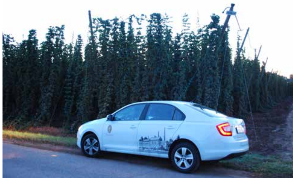
Ranní příjezd na Žatecko