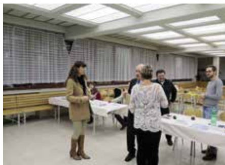
Volební okrsek č. 26