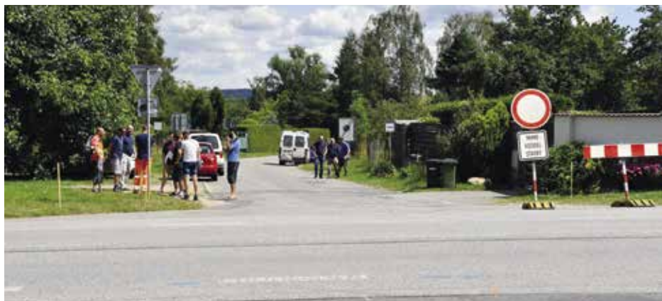
Předání staveniště 27. července