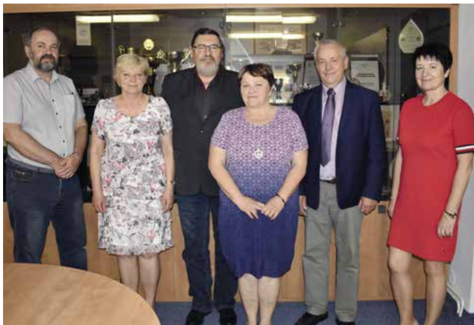
Rozloučení s ředitelkami

JK: Z úvazku učitele 22 hodin přímé vyučovací povinnosti mi v roli ředitelky zůstalo 5 hodin, do hodin jsem se těšila za svými žáky, tam jsem nacházela radost