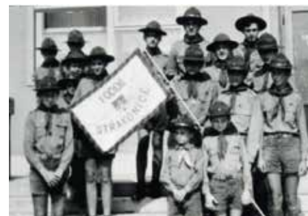
Archivní foto strakonických skautů

Další bobřík mlčení trval opět téměř dvacet let. Signálem zvratu byl 17. listopad 1989. Junáci se hlásili k hnutí Občanského fóra a Veřejnosti proti násilí, s tužbou aktivně se podílet na opětovném vytváření demokratického systému. 2. prosince se koná Junácký aktiv ve Velkém sále Městské knihovny v Praze.