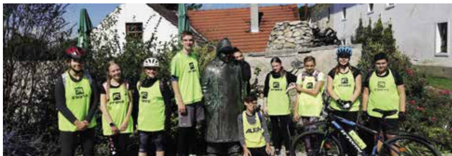
Cyklokurz Putim 2020