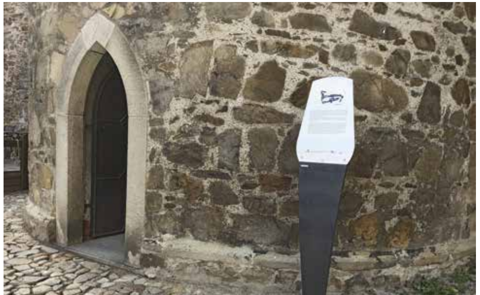
Jeden ze sedmi panelů, který je umístěn pod vyhlídkovou věží Rumpál

Zatím se o historii hradu a jeho okolí dozví turisté a občané více ze sedmi cedulí navigačního systému: Na Dubovci, před zámekem, I. nádvoří – pod kostelem, II. nádvoří – před kapitulní síní, u hradního paláce, pod věží Rumpál, III. nádvoří – u dětského oddělení