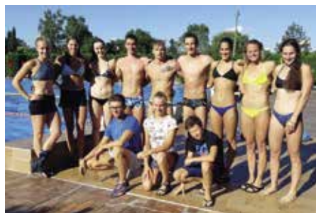
VICTORIA Vysokoškolské sportovní centrum MŠMT

kračovalo i v srpnu a 21. 8. jsme zaznamenali návštěvní rekord letošní sezóny, kdy si našlo cestu do letního areálu 2 050 návštěvníků. Letní sezónu jsme uzavřeli 5. 9., kdy byl letní areál pro veřejnost uzavřen a provoz se vrátil zpět do krytého bazénu. Celkový počet návštěvníků v letním areálu byl za celou sezónu nadprůměrných 28 953 a celková výše tržeb se vyšplhala nakonec na 1,579 milionu. Meziročně je tento výsledek 4. nejlepší od roku 2014.