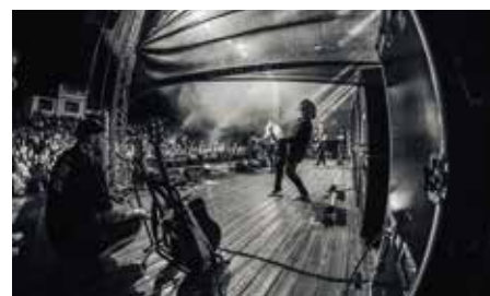
Kulturní akce v letním kině