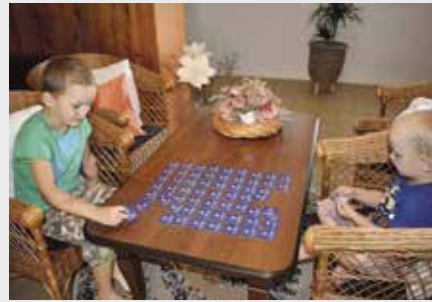
Nad pexesem se děti zabaví

Městské informační centrum, které sídlí již déle než tři roky v prostorách strakonického hradu, vydává nově dvě edice pexesa. Na straně obrázku, k němuž budete hledat ten správný druhý, najdete foto-