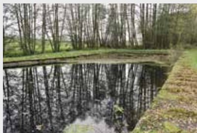
Modlešovicická nádrž není v nejlépeším stavu

V městské části Modlešovice se nachází požární nádrž, která je historicky zakomponována do okolní zástavby a terénu. Měla a má i do budoucna plnit funkci vodohospodářskou a požární, ale vzhledem k jejímu stavu je nezbytná celková rekonstrukce.