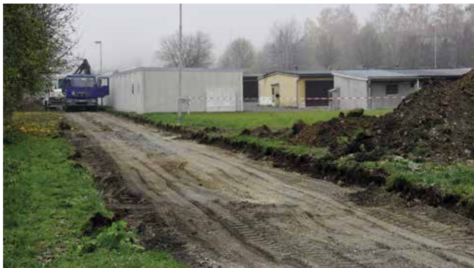
V Mírové ulici se čile pracuje