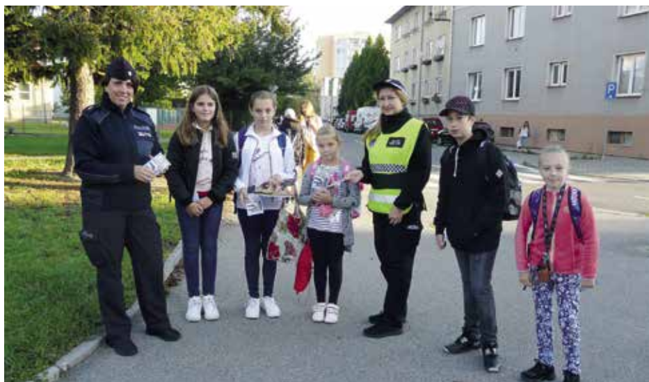
Policisté a strážníci se vrátili na přechody v blízkosti škol

Během října a listopadu se musely všechny naplánované a slíbené akce ve školách odvolat. Nezbyvá než doufat, že s novým rokem přijde zklidnění a preventistky budou moci pokračovat v besedách na druhém stupni, kde apelují zase na jiný nešvar současnosti, na šikanu, kyberšikanu a zneužívání na internetu.