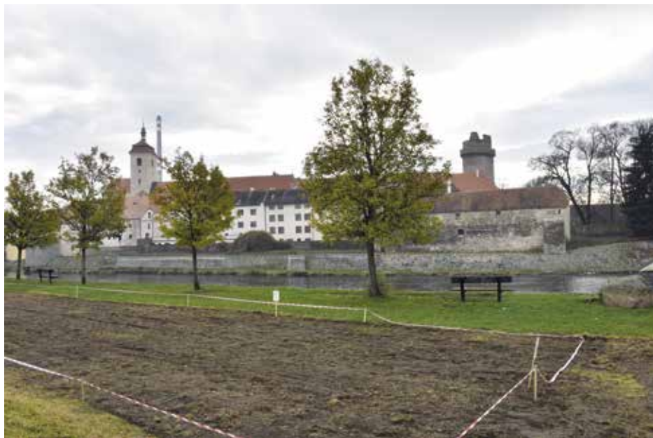
Příprava pozemku pro motýlí louku