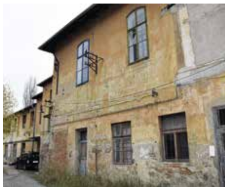
Budova na Ostrově, tady vznikne komunitní centrum

Činnost komunitního centra bude naplňována až po rekonstrukci objektu, a to ve spolupráci s několika spolky. Hlavním partnerem bude spolek Sunshine Cabaret, který bude garantem komunitního centra, komunitně-kulturních akcí, při kterých se budou klienti vzdělávat v kurzech,