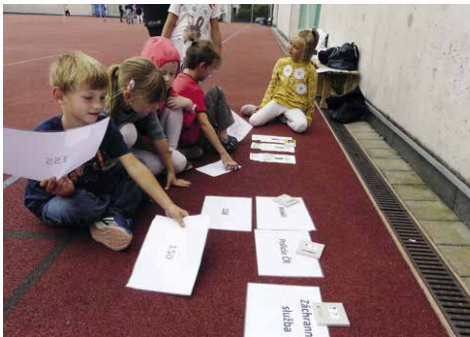
○ tom, jak správně a bezpečně přecházet silnici, jsou besedy šité na míru prvňáčkům

V prvních třídách je beseda o bezpečnosti v provozu doplněna ještě o jednu vážnou situaci, s níž se mohou děti venku setkat. Na závěr besedy, aniž by děti dopředu tušily, o co půjde, sehraje preventistka společně s nimi divadelní skeč – ve třídě pohodí injekční stříkačku a začne se divit, co že to je. Reakce dětí jsou ve skrze povzbudivé. Jen v několika případech chtěly na nalezenou stříkačku sahat a zkoumat ji. Většinou ale po chvíli přijdou s nápadem, že musí informovat paní učitelku. Ta zavolá