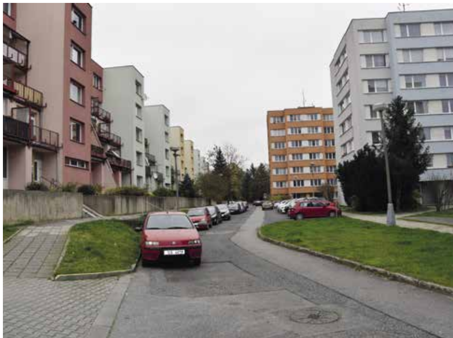
Mlýnská v současné podobě