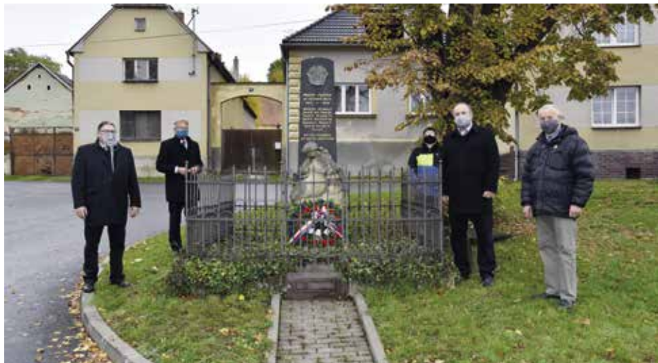
Připomínka Dne vzniku Československa