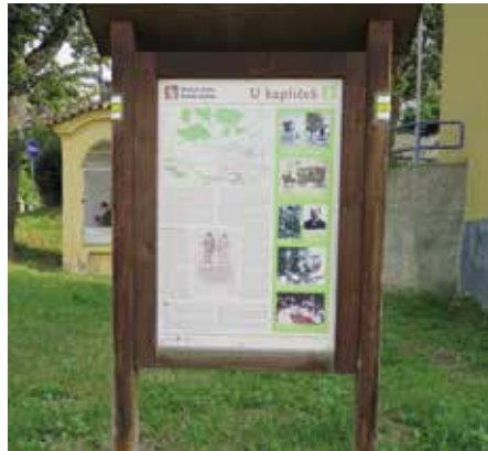
Zastavení U kapliček v ulici MUDr. K. Hradeckého

Stezka je značena žlutým turistickým značením. Značkaři Klubu českých turistů pravidelně obnovují značení a informační prvky, aby návštěvníci stezky nebloudili a dobře se orientovali. Vzhledem k problematickému úseku přes frekventovanou Radomyšlskou silnici a v souvislosti se změnami spojenými s obchvatem města byla v září tohoto roku trasa přeznačena, a to od kapliček v ulici MUDr. K. Hradeckého do ulice Nerudovy a Šmidingerovy. Kolem zahrádkářské oblasti