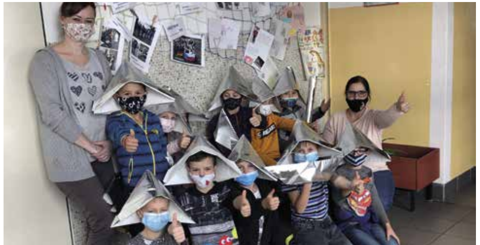
Základní škola Čelakovského slouží jako krizové

V minulém období od 14. října do prosince 2020 jsme zde měli celkem 435 dětí. Běžný denní průměr se pohyboval kolem 21 dětí. Žáci se v dopoledních hodinách vzdělávají, pokud nemají vlastní vybavení pro on-line distanční výuku, zapůjčujeme jim tablet.