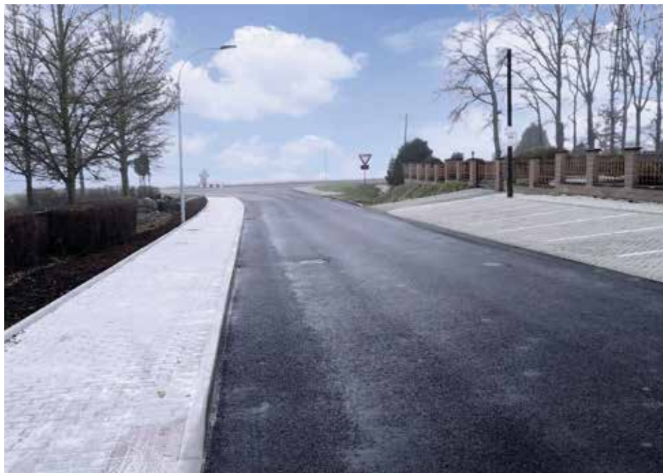
Nové chodníky v ulici Švandy dudáka