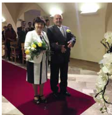
Zlatá svatba manželů Kubešových

Máte-li zájem oslavit významné výročí svatby, přihlaste se osobně na matrice měst-