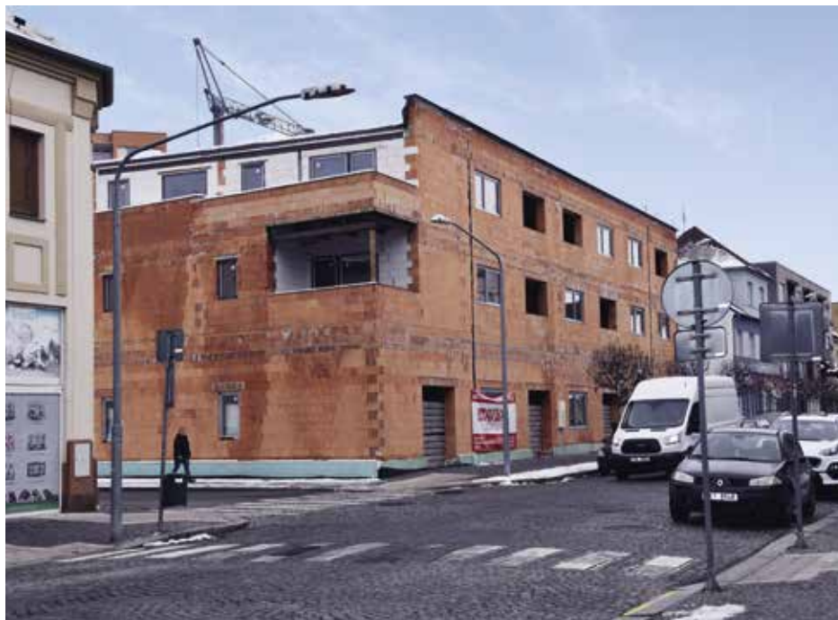
Po vydání stavebního povolení se může stavět