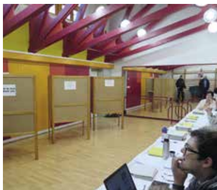
Ilustrační foto, archiv PR

a předání voličského průkazu nemusí být úředně ověřený podpis voliče.