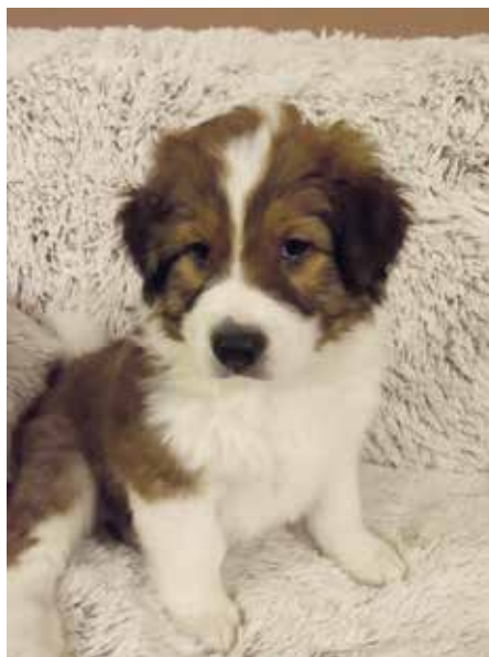
I roztomilé šňeňátko musíte přihlásit k poplatku

Na základě obecně závazné vyhlášky města Strakonice č. 3/2020 dochází od 1. 1. 2021 ke změně sazeb místního poplatku ze psů. V rodinných domech nyní zaplatíte za psa 600 Kč, za druhého a každého dalšího psa 900 Kč. V ostatních obytných domech je výše poplatku 1000 Kč, za dru-